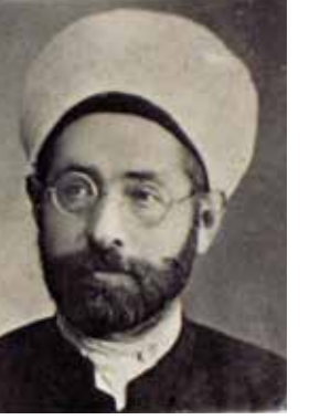
Cemaleddin Seven (179-1:490)

Bugün zaman zaman birtakım kalemlerde daha yüksek sesle dillendirilen bir başka düşünce, Revnakoğlu hayattayken fısıldanmıştı: Bektaşîlik dini. Babası da bir Bektaşî babası olan Revnakoğlu'nun onlarca Bektaşî tekkesi ve yüzlerce Bektaşî babasıyla geçen ömründen sonra 1955'lerde ilk defa bu din dile getirildiğinde şu satırları yazmıştı (195:5): Şurada açıklanması gerekiyor ki Bektaşîlik'in son aydın simalarından Doktor Bedri Noyan'ın İzmir'de yapılan Bektaşî törenlerinin birinde neden icap ettiyse söylemiş olduğu gibi Bektaşîlik bir din değildir ve hiçbir zaman din olamaz, olmamıştır; olması, olabilmesi de düşünülemez, çünkü bundan sonra bir başka din zaten kurulamaz, kurulsu da tutunamaz, yaşayamaz. Bunu denemek isteyen heveslilerin bütün gayret ve teşebbüsleri ancak buldukları yerde sıkışıp kalır, toplumdaki gereken ilgiyi göremez, göremeyeceği için de büyüüp gelişemez, yayılamaz. Herkes bilir ki yeni bir dine artık ihtiyaç yoktur ve kalmamıştır, zira İslâm dini dîn-i ekmeldir, peygamberimiz hâtimü'l-enbiyâdır." Revnakoğlu, bu fikrin hayata geçirilemeyeceğini düşünmüyordu, ama "Bektaşîlik" adıyla olmasa da zaman zaman "Alevîlik dini" hevesi hep bir zümre tarafından taze tutuldu.