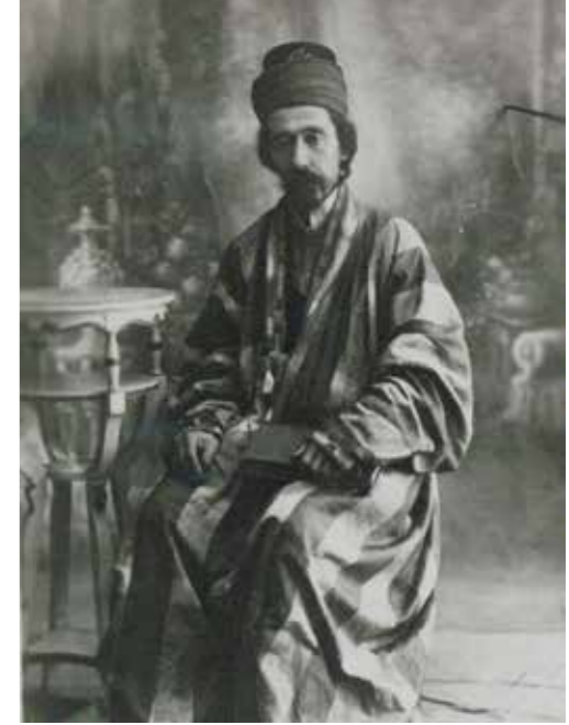
Burhaneddin Belhî (Burhaneddin Kılıç)

Mısır münevverânına telkin eylediği istikamet ve vatanperverlik mefkûresinden dolayı İngiliz hükûmetinin nazar-ı dikkatini celp etmiş ve Mısır'daki nüfuzunun tezelzülünden endişe eden hükûmet-i mezkûre tarafından Seyyid Cemaleddin'e Mısır'ı terk etmesi bir sûret-i nâzikânede ifham olunması üze-