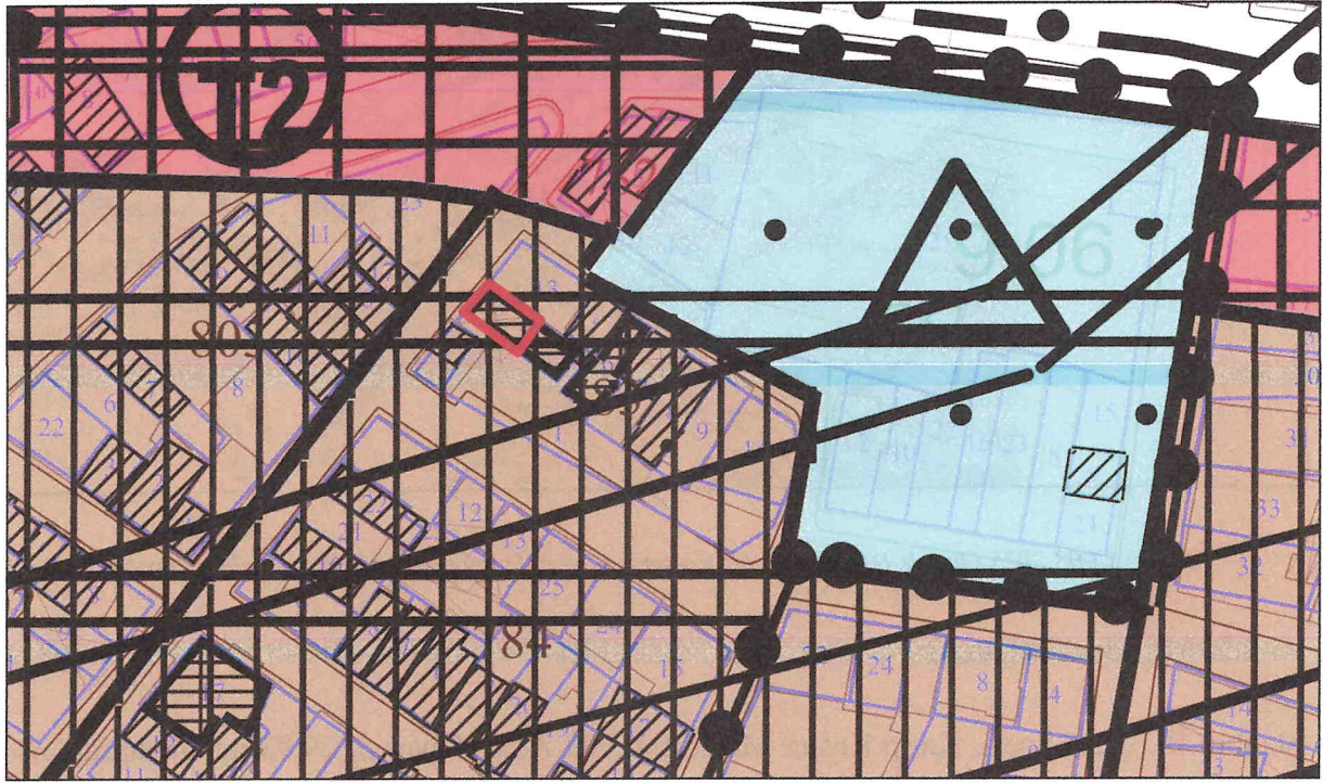
Şekil 5: Fatih İlçesi 1/5000 Ölçekli Koruma Amaçlı Nazım İmar Planı'ndaki Durumu

Plan değişikliğine konu alan, 30.12.2011 onay tarihli 1/5000 ölçekli Tarihi Yarımada Koruma Amaçlı Nazım İmar Planında Konut Alanları lejantında kalmakta olup parsel üzerinde tescil taraması bulunmaktadır.