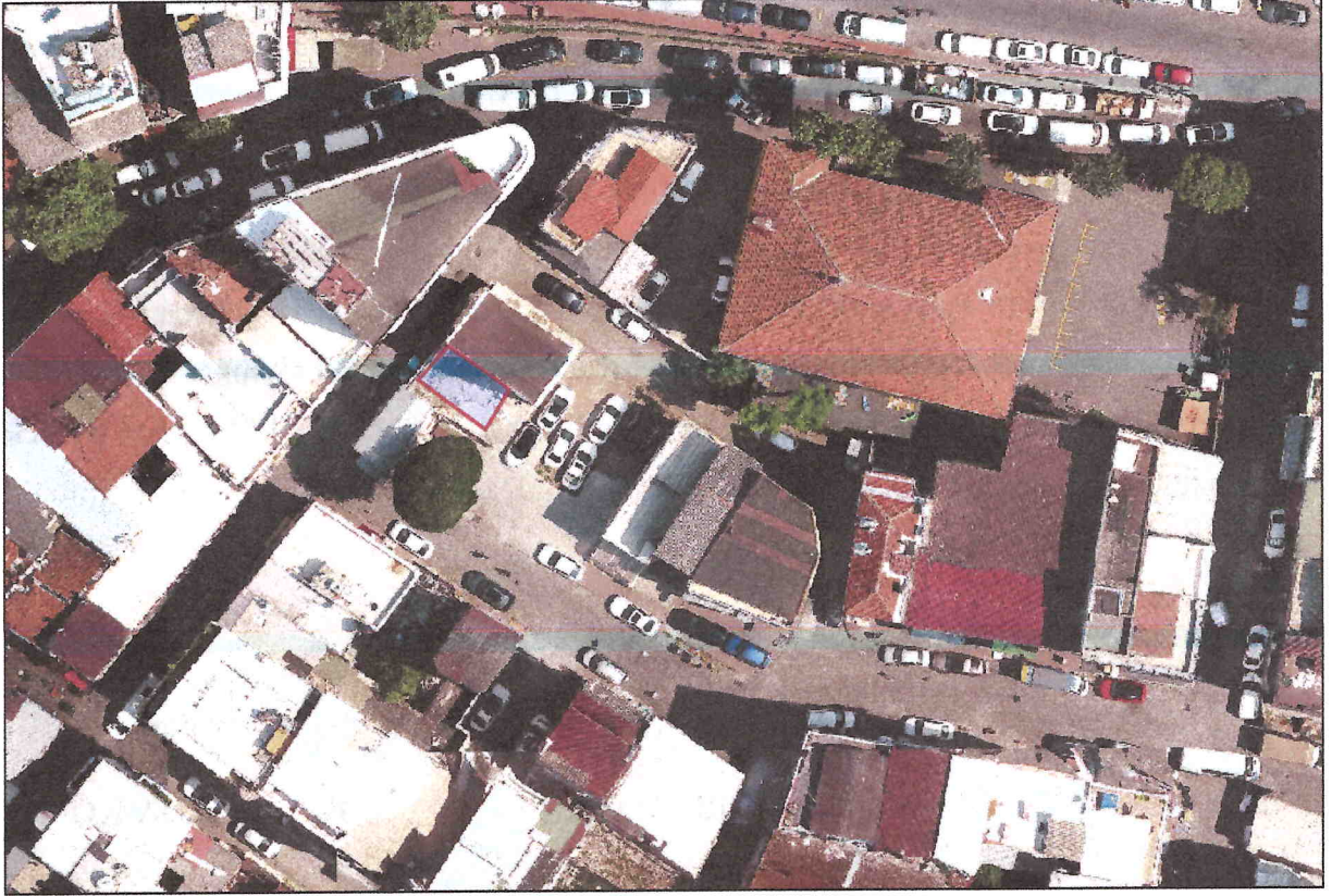
Şekil 7: Planlama Alanı Uydu Görüntüsü