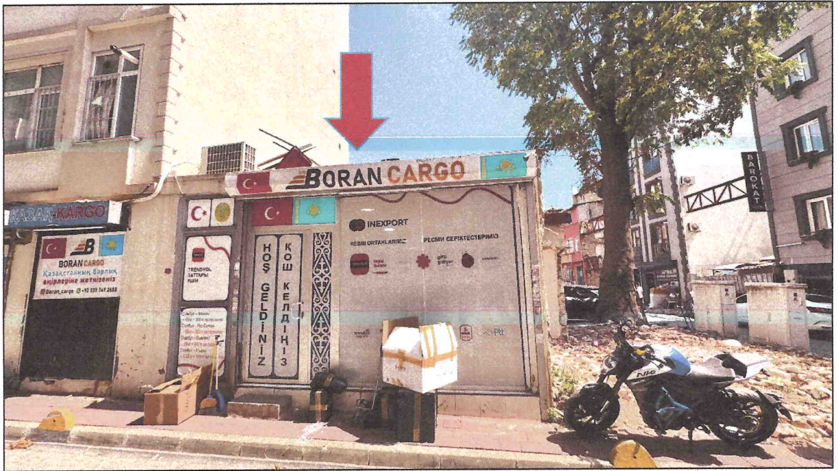
Şekil 8: Planlama Alanının Hadım Odaları Sokağı Üzerinden Görünümü