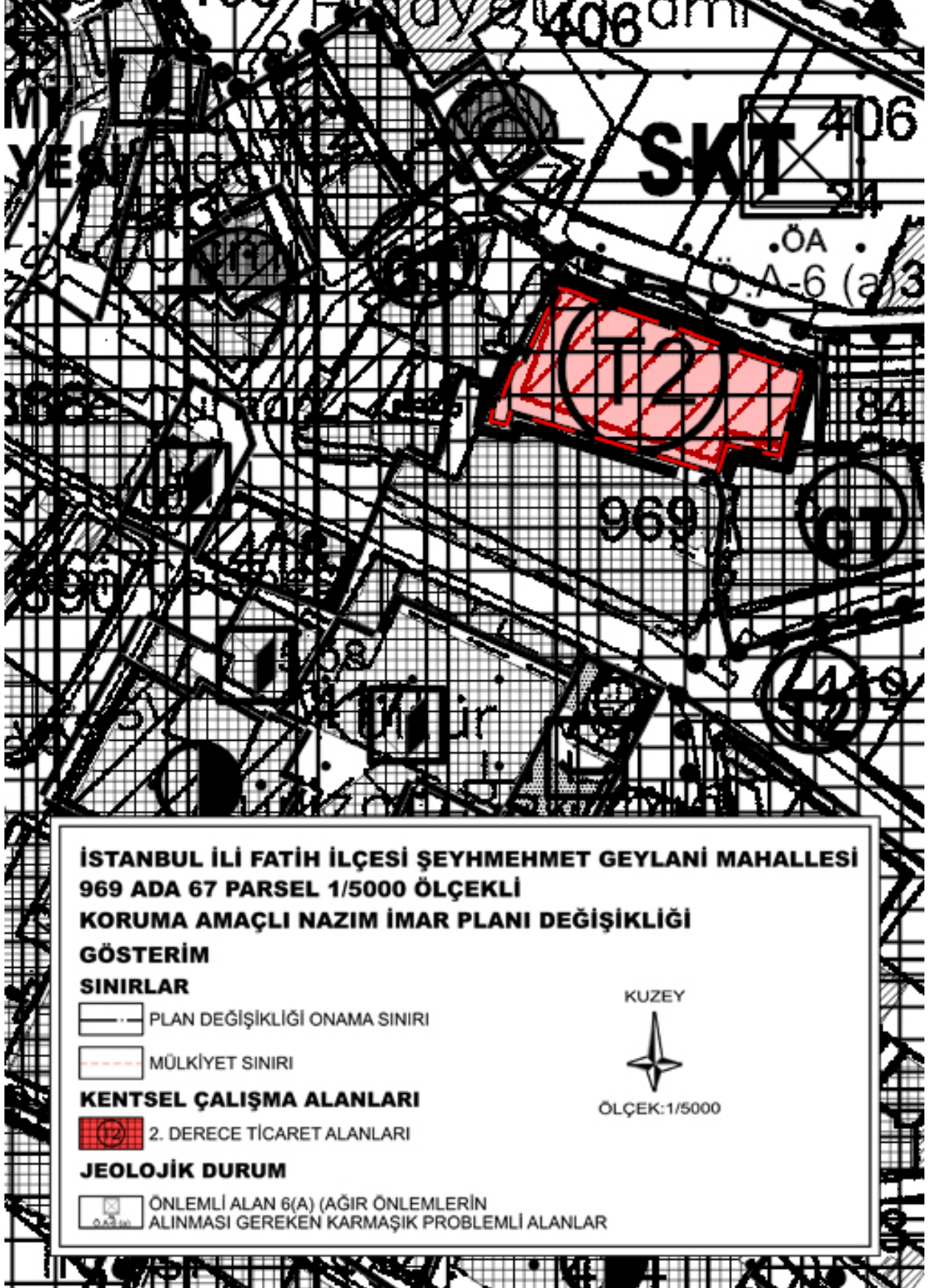
Harita 1. 1/5000 Ölçekli Koruma Amaçlı Nazım İmar Planı Değişikliği