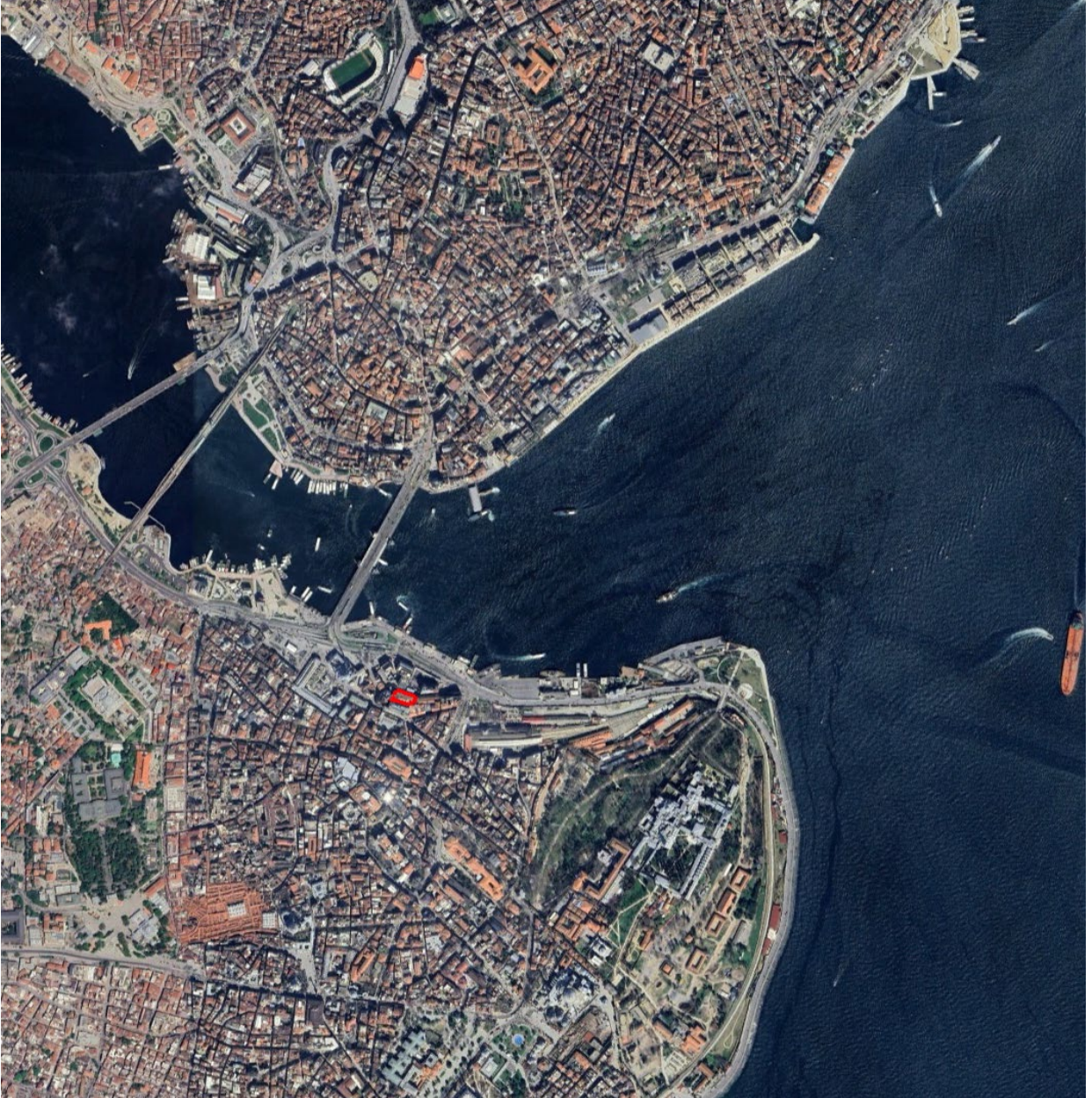
Resim 1. Uydu Görüntüsü

Planlama alanı, İstanbul ili, Fatih ilçesi, Şeyhmehmet Geylani Mahallesi sınırları içinde kalmaktadır. Fatih ilçesi, İstanbul iline bağlı 39 ilçeden biri olup İstanbul Büyükşehir Belediyesi sınırları içerisinde, şehir merkezinin batısında yer almaktadır.